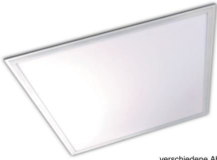
verschiedene Abmessungen No-Flicker